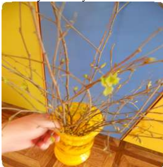
График наблюдений за развитием побега из почки